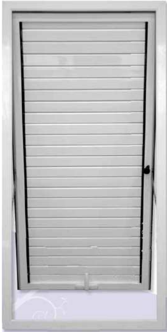
Detalles de la apertura