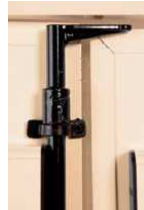
Diseño del cerrojo