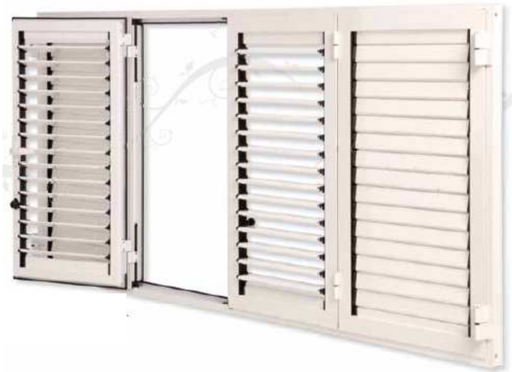
Mallorquina Abatible 4 hojas Lama móvil

Mallorquina abatible de fabricación desde una a cuatro hojas abatibles. Posibilidad de fabricar formas. Lama fija y móvil.