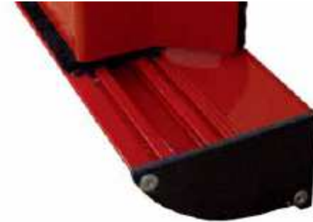
Detalle del perfil inferior