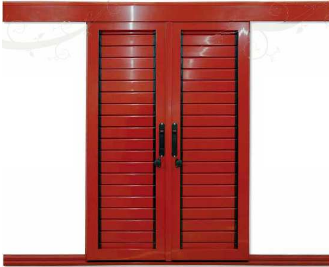
Mallorquina corredera 2 hojas

Mallorquina especialmente diseñada para la instalación exterior en fachadas, aportando a la edificación una apariencia vanguardista.