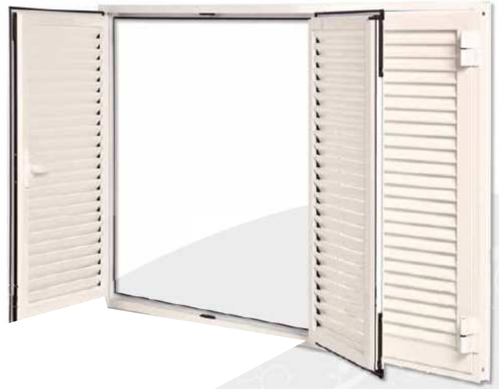
Mallorquina Abatible 3 hojas Lama fija