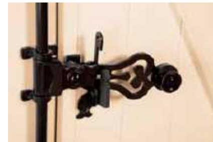
Detalle del accionamiento