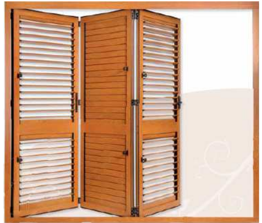
Mallorquina Plegable 3 hojas (en apertura)