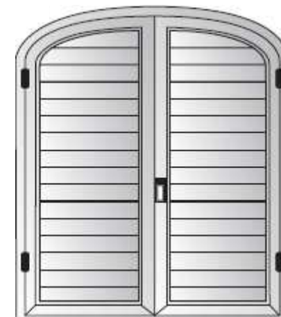
Carpanel dos radios