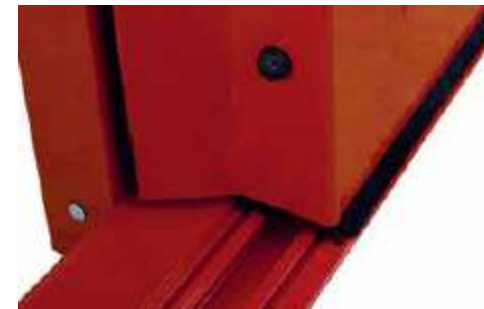
Detalle de sellados entre perfiles