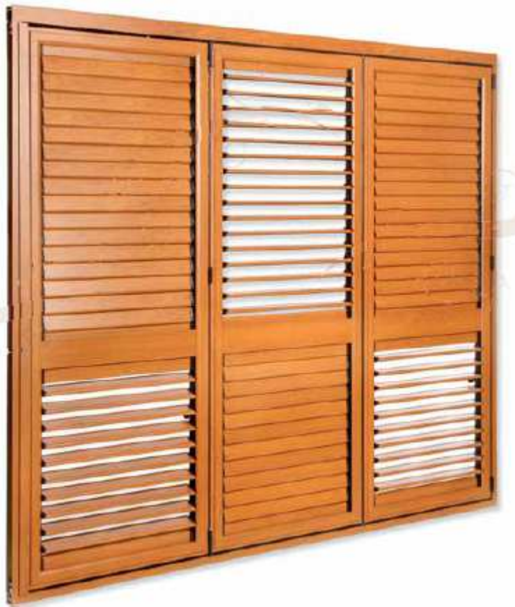
Mallorquina Plegable 3 hojas (cerrada)

Mallorquina con posibilidad de incluir el número de hojas deseado, adaptando al ancho del hueco.