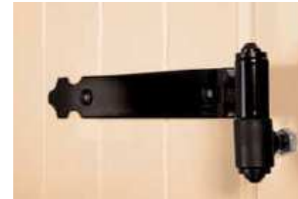
Diseño de la bisagra